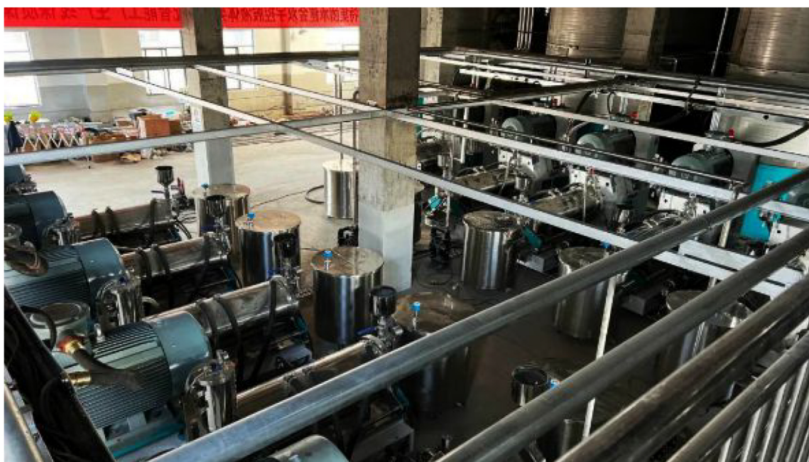
▲浙江金双宇EPC整体项目

浙江金双宇始创于2002年，总占地面积二千余亩，是集染料、助剂、针织印染生产加工、海洋石油勘探船舶业等研发、生产、销售和施工技术服务为一体的大型现代化企业，是中国染料工业协会理事单位、浙江省染料工业协会理事单位及上海涂料染料行业协会理事单位，是中国染料助剂著名领先品牌。