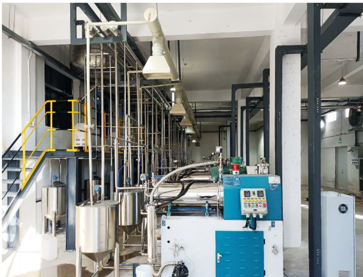
▲山东某客户项目安装调试现场

四季度中，儒特集团除了很多EPC总包项目进入年底收官阶段之外，还有大批单机和小成套项目成功完成了安装调试。奋斗路上，我们的脚步从未停下，我们的坚持从未改变。2021已收尾，在新的2022年里，我们会继续因热爱而坚持，更因坚持而卓越！