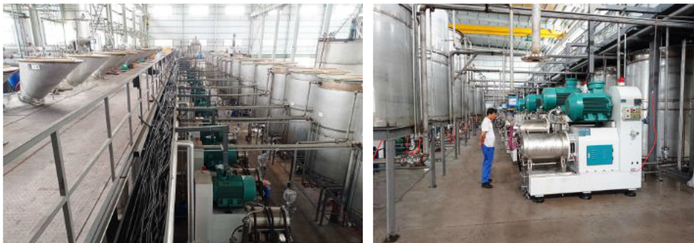
▲浙江科峰EPC项目现场

儒特集团提供的智慧工厂生产线EPC总包服务，具有生产排单柔性化、生产作业数字化、质量控制可追溯、生产设备自管理、生产管理透明化、物流配送智能化的绝对优势。在项目初期与客户充分沟通，做好市场调研，依托多年的单机智能设备设计能力，为客户设计最合理、最高效、最可持续的方案；在采购阶段，自产设备出厂严格检验，外采设备供应商严格把关，为客户做到最优成本控制及管理；在施工阶段，从设备生产、土建电气、安装保障、试机运行等方面层层把控，每一个环节都做到极致。