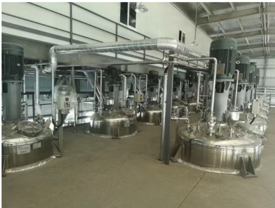
▲安徽某客户项目安装调试现场