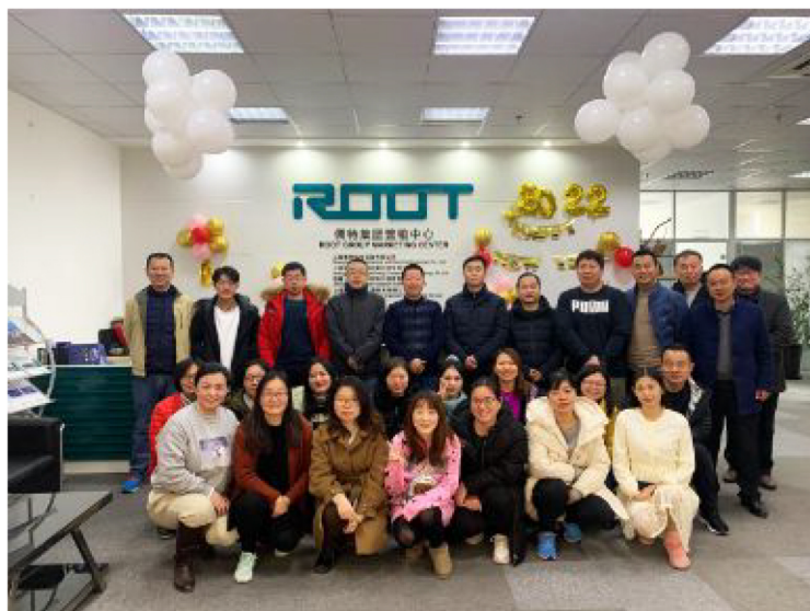
▲儒特集团元旦迎新年活动现场