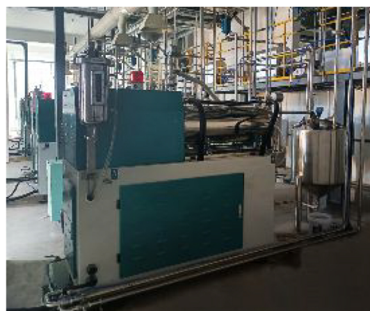
▲山东某客户项目安装调试现场