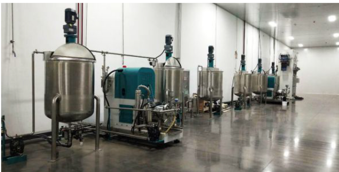
▲国轩高科EPC项目现场

儒特成功携手合肥国轩高科，对电池导电浆料生产线进行全新升级，项目标的人民币两百万元（虽然合同标的不高，但意义重大，标志着儒特正式被新能源电池行业领军企业认可的里程碑意义）。儒特在设计、采购、施工层面的专业为国轩高科搭建新型智能生产线，使其生产效率大大提高，行业竞争力不断提升，真正实现高效、节能、环保型生产。