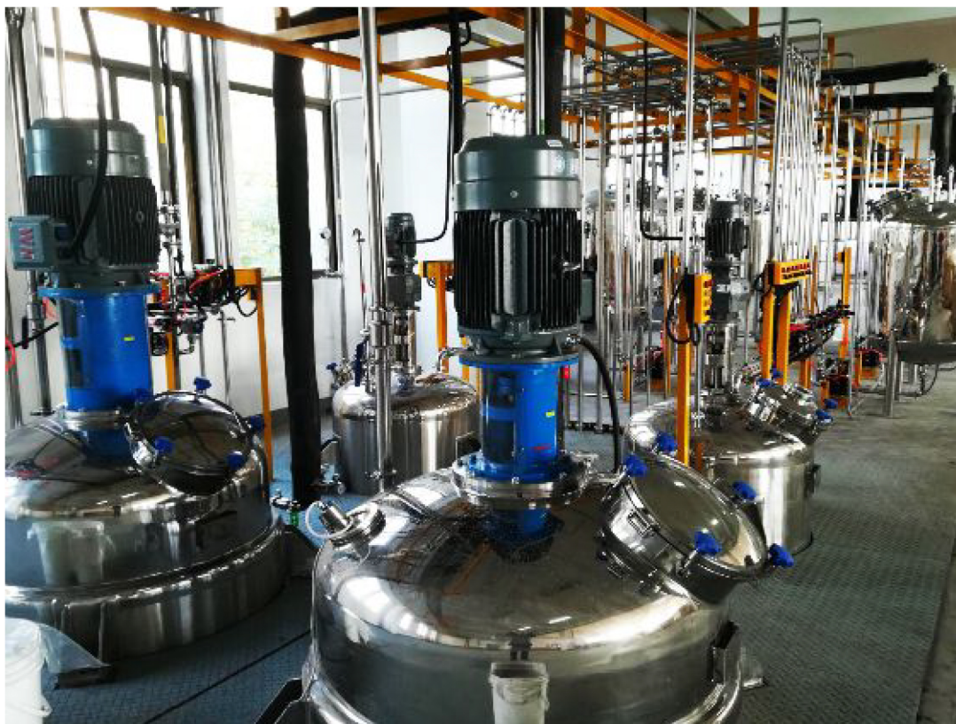
▲江苏某客户项目安装调试现场