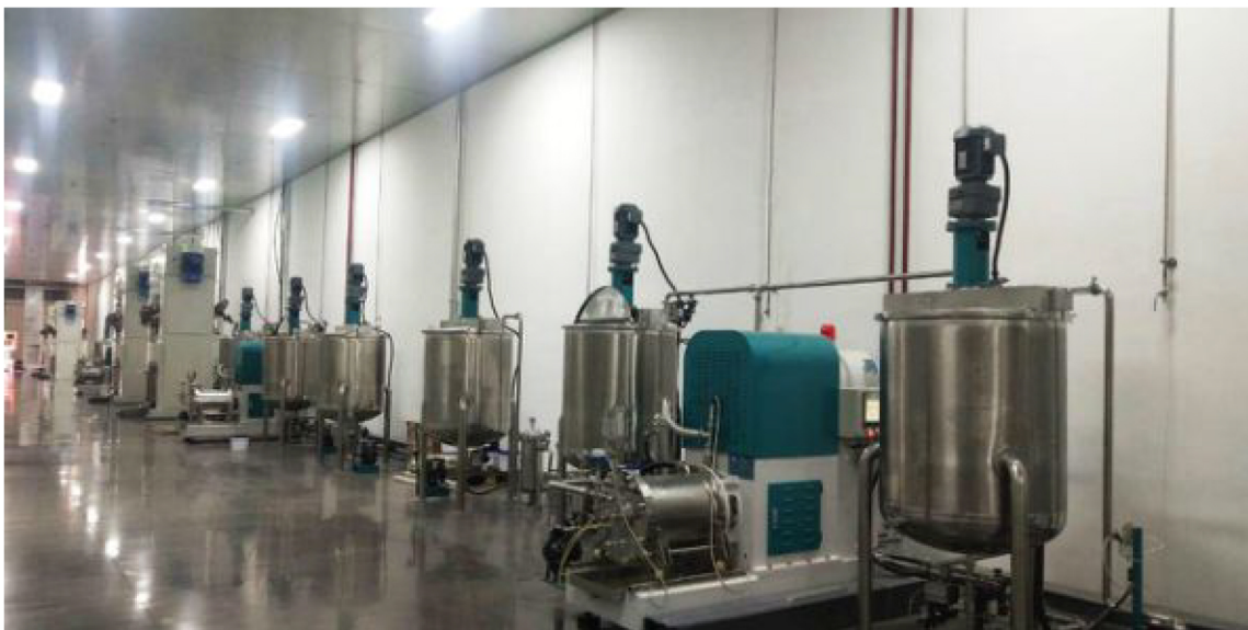
▲国轩高科EPC项目现场

合肥国轩高科动力能源有限公司成立于2006年5月，是国内最早从事新能源汽车动力锂离子电池自主研发、生产和销售的企业之一。产品广泛应用于纯电动商用车、乘用车、物流车和混合动力汽车等新能源汽车领域，并与国内多家主要新能源整车企业建立了长期战略合作关系。