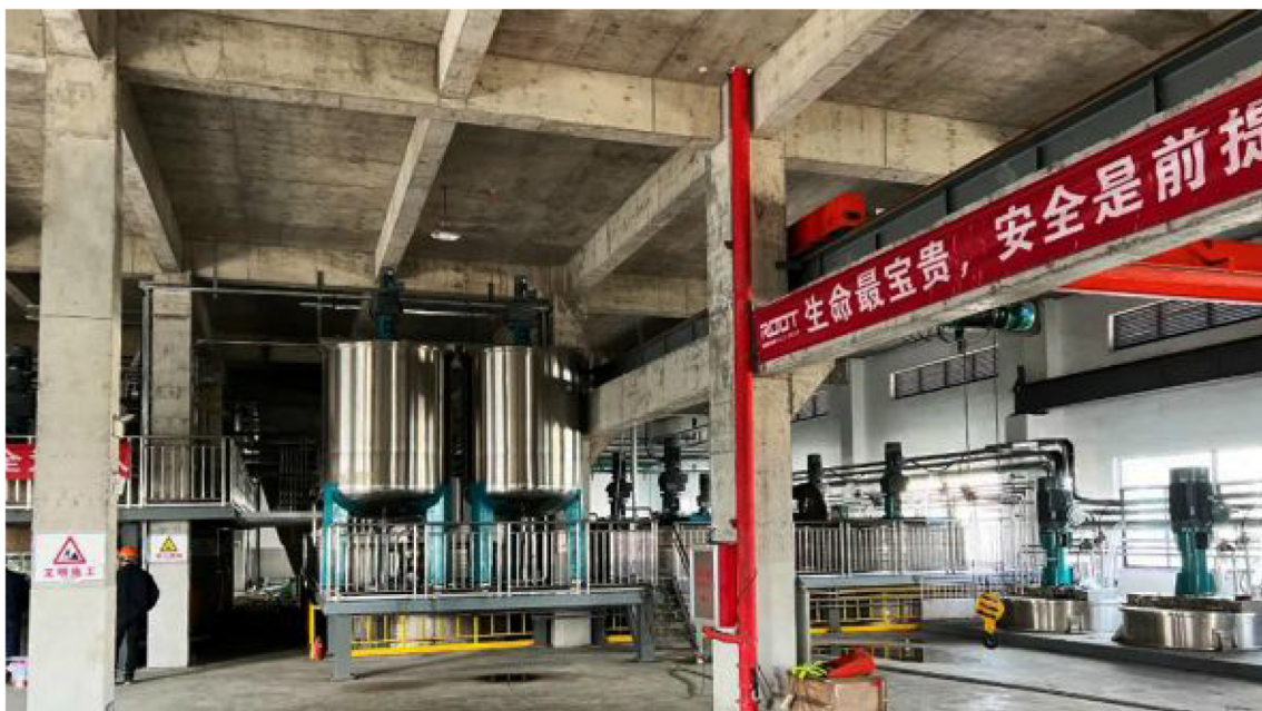
▲浙江金双宇EPC项目现场