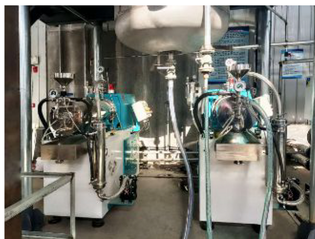
▲山东某客户项目安装调试现场