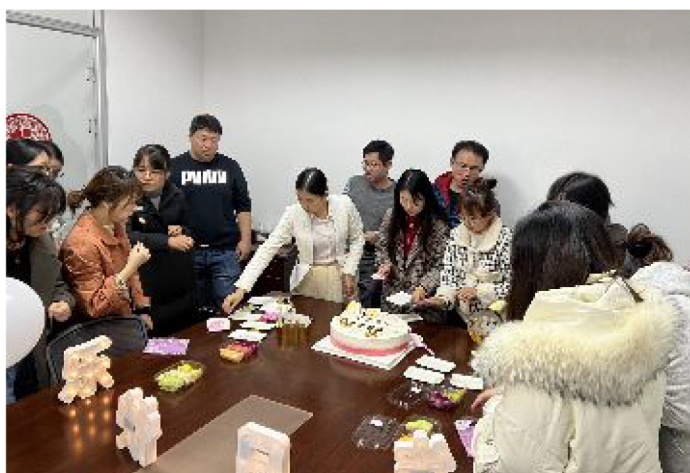
▲儒特集团员工生日会现场