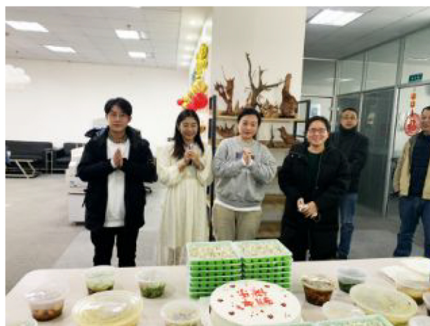
▲儒特集团元旦迎新年活动现场