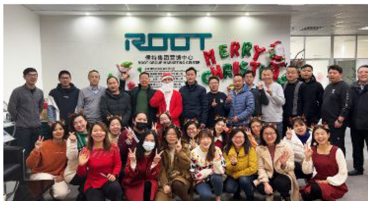
▲儒特集团圣诞节活动现场

感恩，是儒特一直以来的核心价值观，我们感恩在奋斗路上有每位儒特家人的相伴，我们朝着共同的目标奔跑，只为携手欣赏更高处的风景。每到节日，儒特都会为家人们送上精心准备的节日惊喜与福利，让生活充满仪式感，也表达了儒特对家人们一路相伴的感恩之心，感恩有你，携手同行。