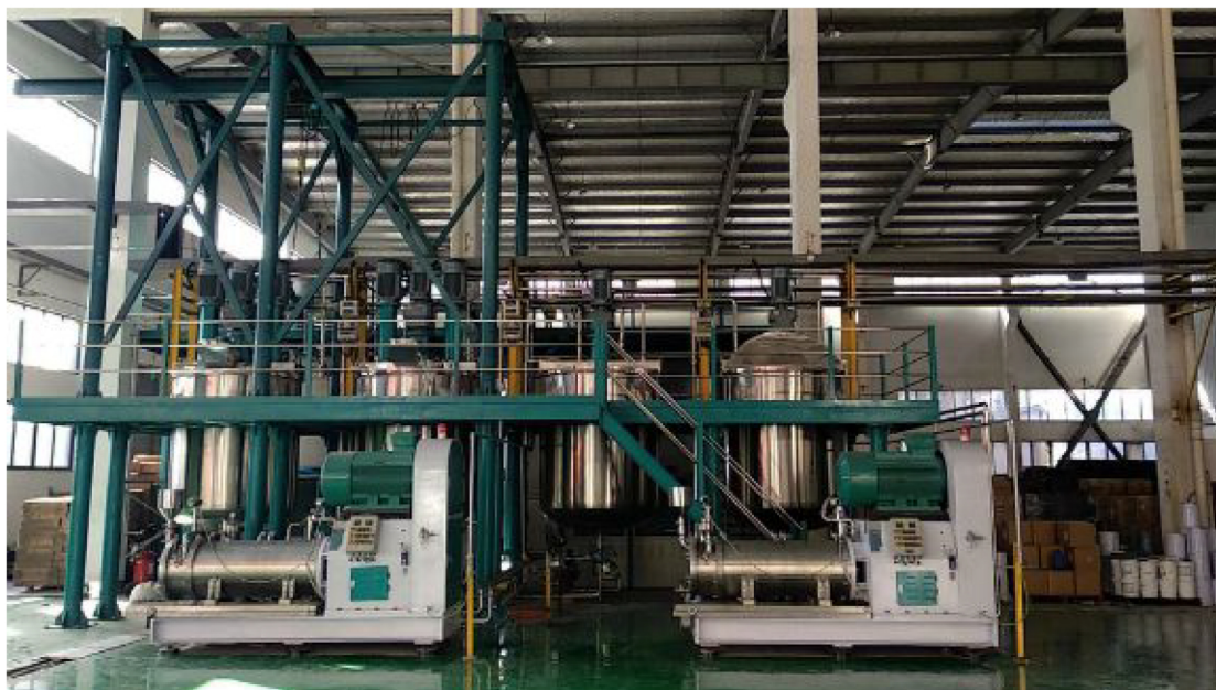
▲浙江欧亚EPC项目现场

儒特集团入驻浙江欧亚，助力企业升级染料生产线，总合同标的人民币一千万元，专业高效的设计方案、精益求精的质量品质、严格的成本控制以及HSE管理，为企业打造全新智慧工厂，推动企业迅速发展，市场份额不断攀升。