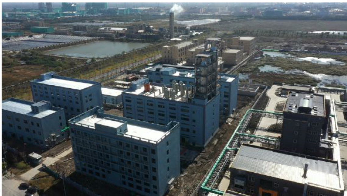
▲浙江金双宇EPC整体项目

浙江金双宇始创于2002年，总占地面积二千余亩，是集染料、助剂、针织印染生产加工、海洋石油勘探船舶业等研发、生产、销售和施工技术服务为一体的大型现代化企业，是中国染料工业协会理事单位、浙江省染料工业协会理事单位及上海涂料染料行业协会理事单位，是中国染料助剂著名领先品牌。