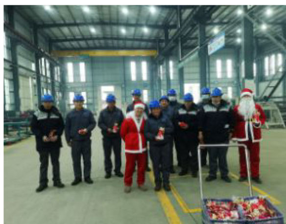
▲儒特集团圣诞节活动现场