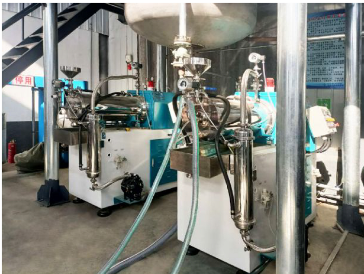
▲山东某客户项目安装调试现场