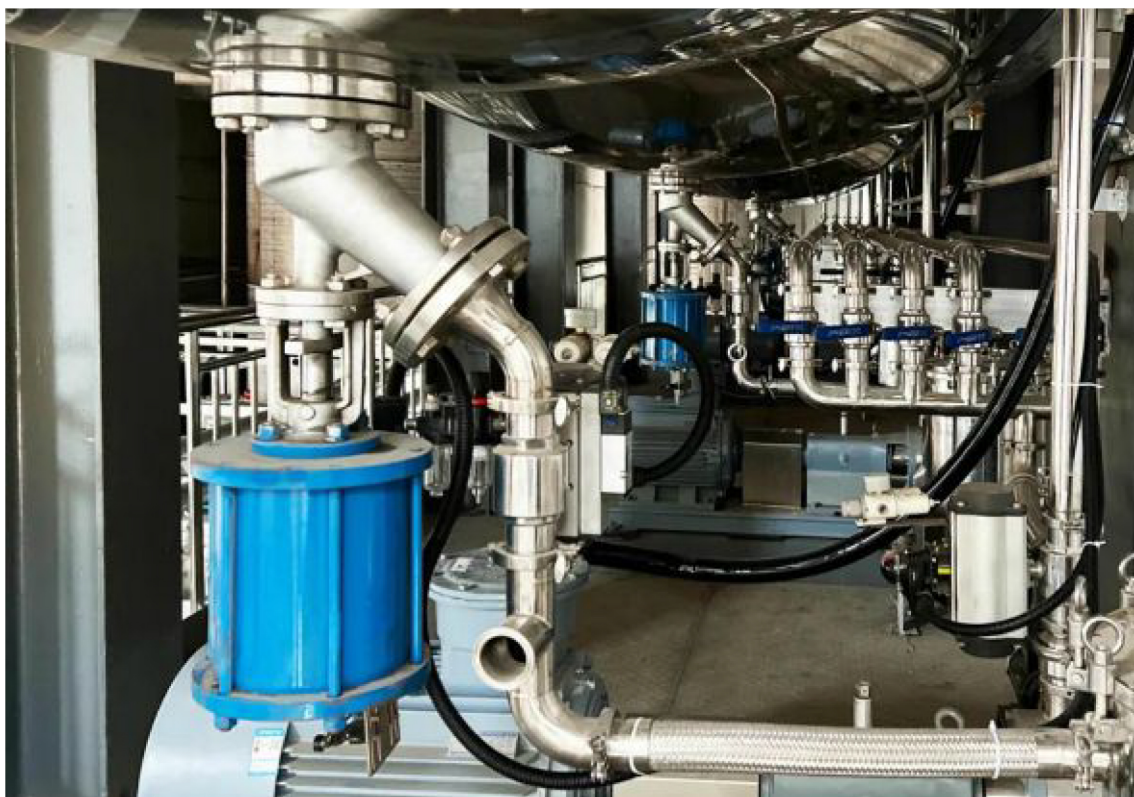
▲浙江金双宇EPC项目现场