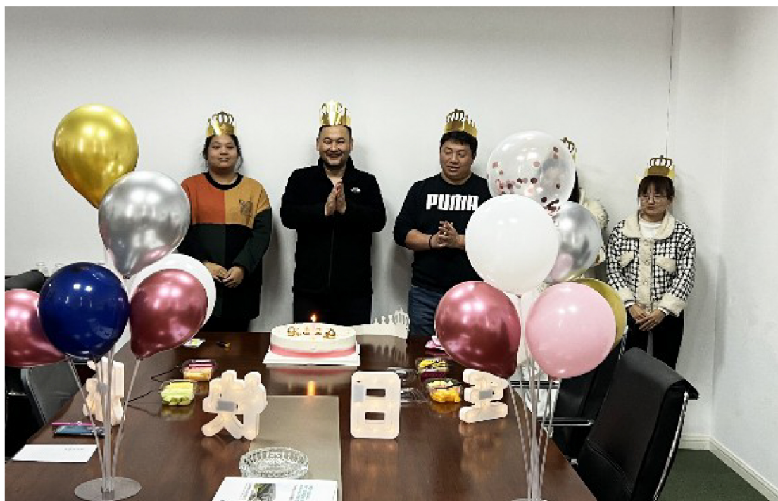
▲儒特集团员工生日会现场

岁月见证成长，时光镌刻幸福，生日的意义非同寻常，每一次的生日都值得纪念。儒特员工生日会每月都会如期举行，精心布置的生日会现场，琳琅满目的美食，更有数不尽的欢声笑语……唱一首生日赞歌，尝一块甜蜜蛋糕，每个人都为寿星们献上最真诚的祝福，一定是特别的缘分，我们才会相聚在一起！