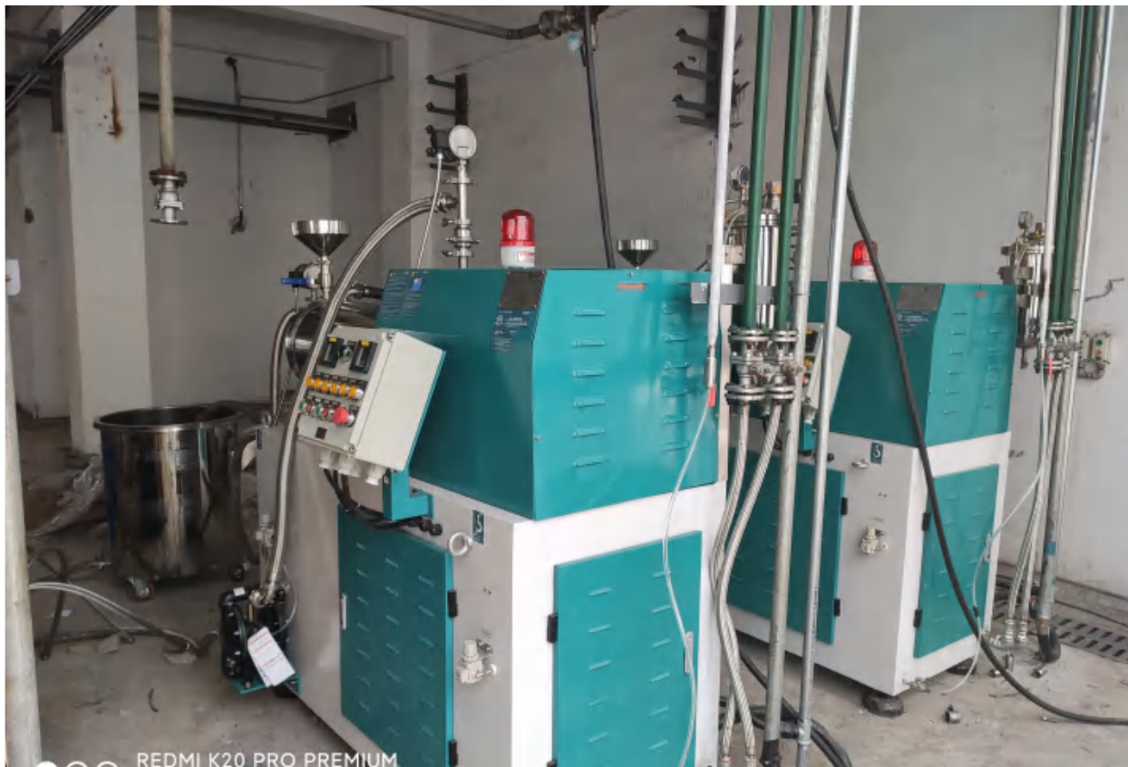
安徽客户 RTSM-60AJ 调试现场