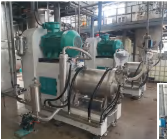
浙江某分散染料项目生产线圆满收工