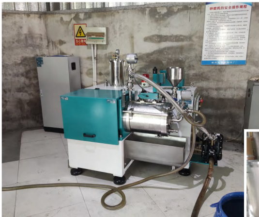
RTSM-10BJ 助力化工行业助剂物料研磨