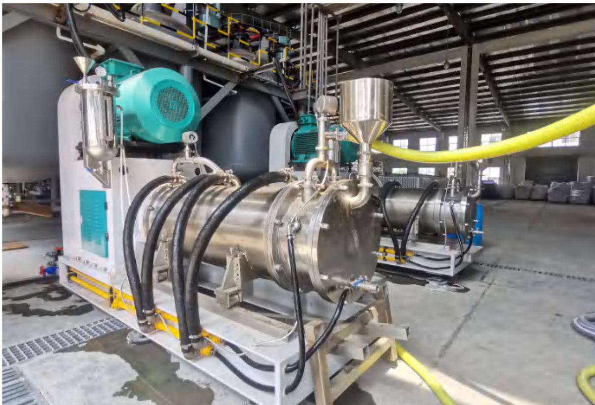
染料 246 黄，RTSM-300AJP 投入生产